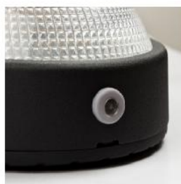
Testknapp med LED-indikering